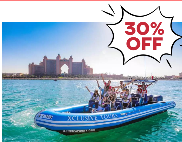
90 Min Guided Sightseeing Tour