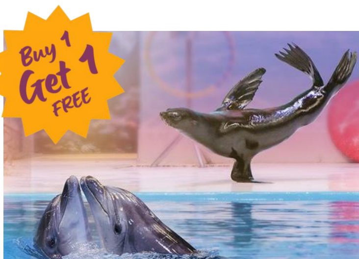
Dubai Dolphinarium – Dolphin & Seal Show Ticket

9月30日前出發，阿聯酋航空送出 My Emirates Pass 可享有大量折扣優惠，不能盡錄